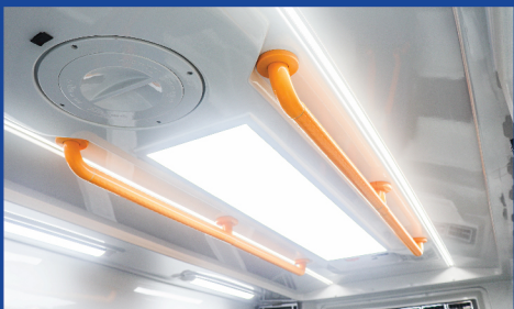
มีฉนวนพลาสติกโพลูเอทิลีน Anti-bacterial