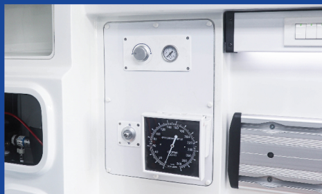
แผงควบคุมระบบออกซิเจน (แบบ Pipe Line)