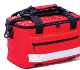
กระเป๋าปฐมพยาบาล First Aid Kits

(ผ่านการทดสอบ มาตรฐาน EN-1789 10G แบบ Dynamic 10กน X+)