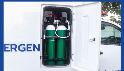
สะดวก สบาย กับ ประสิทธิภาพสูงถึง oxygen จากภายนอก