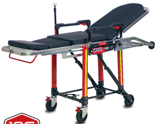
เตียงรถพยาบาล Stretcher Werk Pro 5

(ผ่านการทดสอบ มาตรฐาน EN-1789 10G แบบ Dynamic 10กน X+)